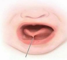
КОРОТКАЯ УЗДЕКА ЯЗЫКА

Подъязычная уздечка – перепонка, которая находится под языком и язык с подъязычным пространством. В норме уздечка довольно эластична, тянется и прикрепляется к языку в средней его части. У ребенка 5 лет растянутом состоянии должна быть не менее 8 мм.